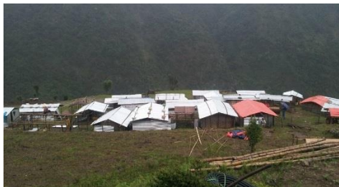
Le village de Purdu en cours de remontage

Les habitants ont été contraints de démonter leurs maisons pour les reconstruire sur un site sécurisé mais dépourvu de source.